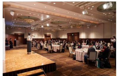
第5回日本子育て支援大賞 表彰式の様子